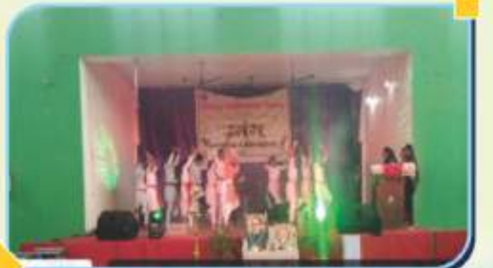
उमंग वार्षिकोत्सव प्रसंगी समूह नृत्य सादर करताना महाविद्यालयाचे विद्यार्थी