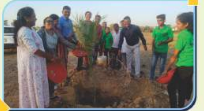
राष्ट्रीय सेवा योजनेतील स्वयंसेवक विशेष शिबीरात परिसरात वृक्षारोपण व श्रमदान करतांना