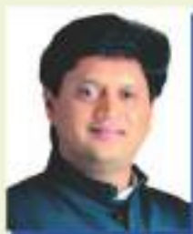
Hon. Shri Rajendra B. Mulak Ex. Minister of State, (Govt. of Maharashtra) Finance & Planning, Energy, Water Resources, Parliamentary Affairs & Excise Hon. Secretary, B.C.Y.R.C. and B.M.C.T.