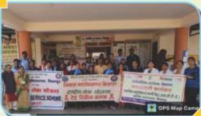
१ डिसेंबर २०२२ रोजी जागतिक एड्स दिनानिमित्त रॅलीचे आयोजन