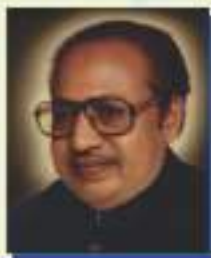
Hon. Late Shri Bhausaheb Mulak Ex. Minister, Maharashtra State Ex. Mayor-NMC, Founder Chairman Backward Class Youth Relief Committee & Bhausaheb Mulak Charitable Trust, Nagpur